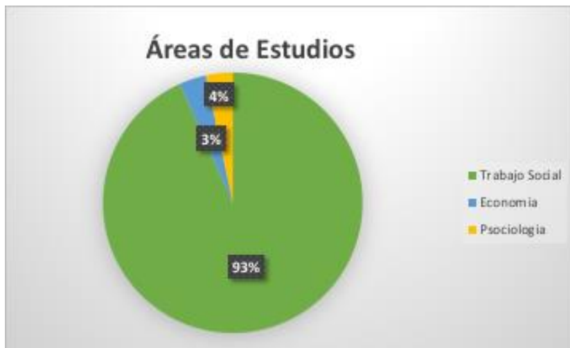
Grafica 2: Áreas de Estudios

Por consiguiente, desde el Trabajo Social se puede analizar la influencia de la comunidad, la cultura y las estructuras sociales en las oportunidades educativas y el acceso a recursos; desde la economía, se examina la disponibilidad de recursos financieros, las oportunidades laborales locales y la economía rural; desde la psicología se explorar aspectos relacionados a la configuración de la identidad y aspectos emocionales (Ver grafica 2).