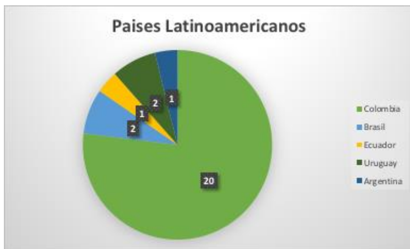
Grafica 1: Países latinoamericanos

Esta revisión bibliográfica basada en las condiciones socioeconómicas de los jóvenes rurales en Colombia dio lugar a la identificación de 30 estudios los cuales 20 corresponden a Colombia y 10 de México, Brasil, Uruguay y Ecuador (Ver grafica 1).