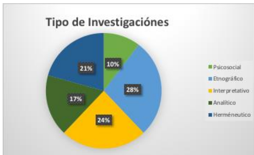
Grafica 4: tipos de investigación

Igualmente, desde la perspectiva interpretativa, se centró en comprender el significado subjetivo que los jóvenes rurales atribuyen a sus experiencias y entornos, permitiendo una comprensión de su realidad desde su propia perspectiva, así mismo desde la perspectiva hermenéutica se enfocó en la interpretación y comprensión de textos y discursos, analizando narrativas y testimonios de jóvenes rurales para revelar aspectos subyacentes de su experiencia y de la perspectiva analítica, se proporcionaron herramientas para descomponer y examinar los datos cuantitativos y cualitativos relacionados con las condiciones de los jóvenes rurales, permitiendo identificar patrones, tendencias y correlaciones significativas ( Ver grafica 4).