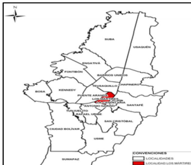
Figura 1: Localidad de Los Mártires

En Los Mártires se localizan 10.085 de las empresas de Bogotá (4,9%). La estructura empresarial de la localidad se concentra en el sector de los servicios (80%), industria (18%) y construcción (1%). • En la localidad hay una alta presencia de microempresarios. Del total de empresas (10.085), 8.567 son microempresas, que representaron el 85% de la localidad y el 4,9% de las empresas de Bogotá. • Los sectores económicos más importantes de la localidad Los Mártires son: comercio (58% de las empresas), industria (18%), hoteles y restaurantes (6.5%) y actividades inmobiliarias, empresariales y de alquiler (6%). (Cámara de Comercio de Bogotá, 2006)